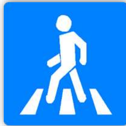
Е, 12 c